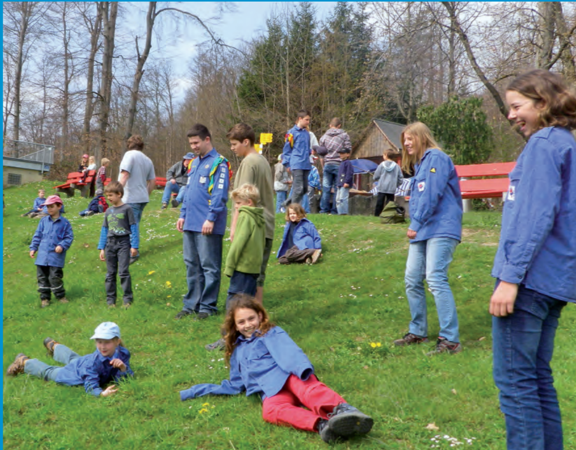
Cevi-Nachmittag auf der Stäfner Risi