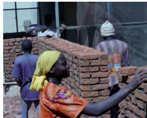
1970 – 2010 | 40 JAHRE ÖKUMENISCHE ARBEITSGRUPPE FÜR ENTWICKLUNGSHILFE STÄFA-ÜRİKON