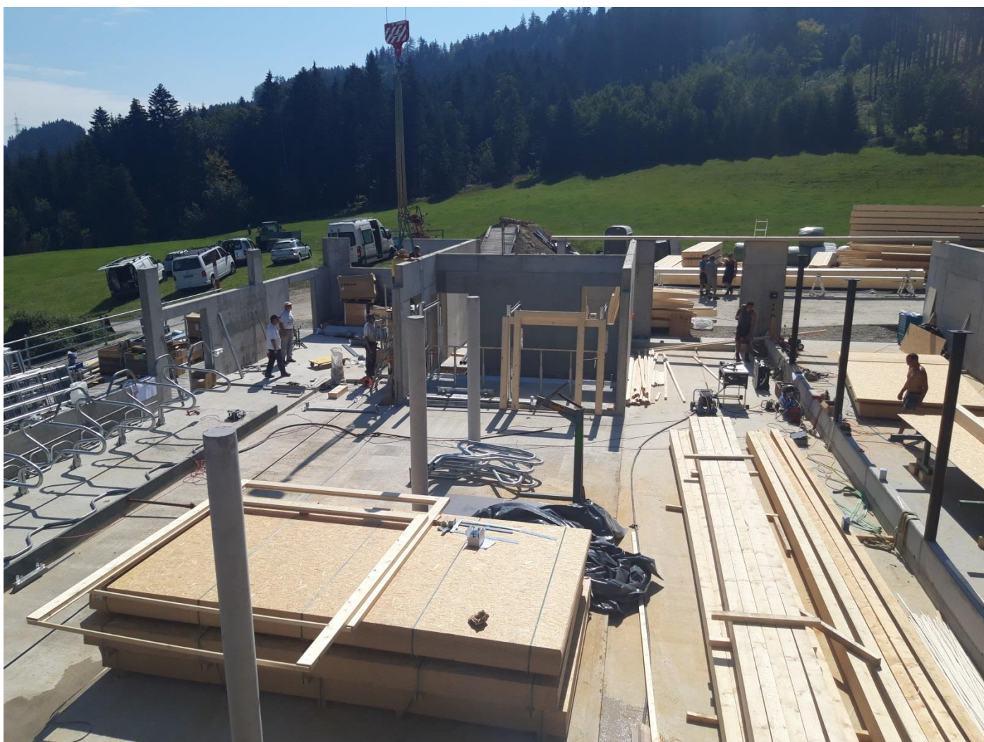
Aufbaulager 2018 im Appenzell (AR)

Männer und Frauen – jüngere und ältere - unterstützen Bergbauern bei ihren baulichen Projekten auf dem Hof